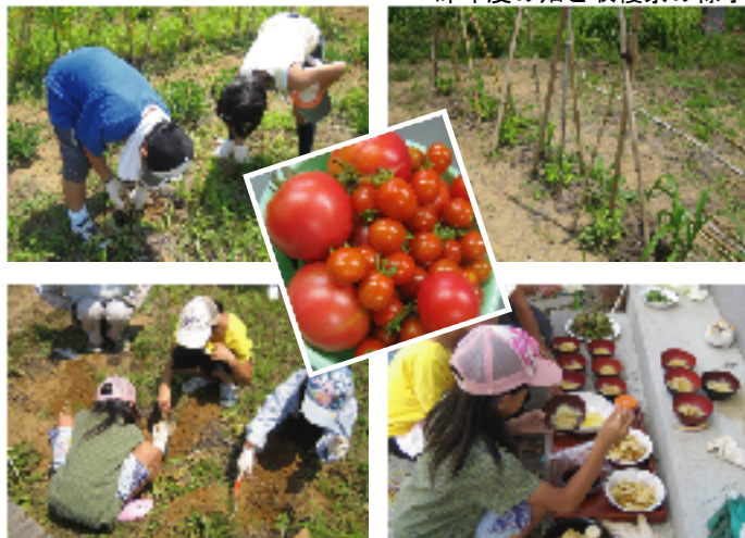
昨年度の畑と収穫祭の様子

5月11日(月)のイベントで、子ども達と一緒に種まきや、苗の移植を行いました。かやぶんブログ、「かやぶんニュース」 http://npokaya.exblog.jp/ で随時、畑の様子をお伝えします。7月には収穫祭イベントを行う予定です。お楽しみに!