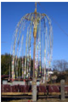
浅尾新田おやなぎ 1月13日

1月8日から15日にかけて、明野町のあちこちの地区で小正月の行事が行われました。地域の人呼びかけにより、絶えていた行事が新たに復活した地区もあります。茅ヶ岳歴史文化研究所は各地の行事を取材し、それらの様子を記録におさめました。