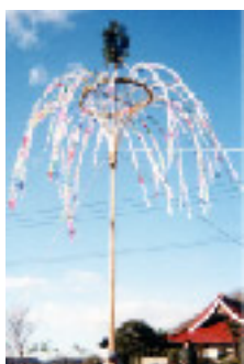
小笠原おやなぎ 1月8日