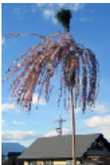
一本松おやなぎ 1月8日