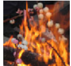
中込どんどこ焼き 1月14日