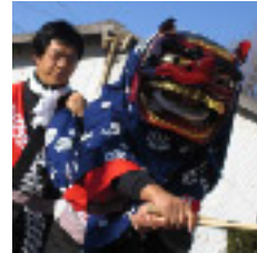
上神取(上)獅子舞 1月15日