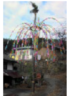
正楽寺おやなぎ 1月15日