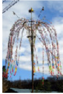
上神取(上)おやなぎ 1月15日