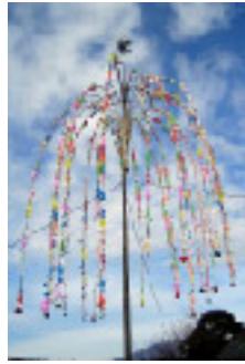
上神取(下)おやなぎ 1月15日