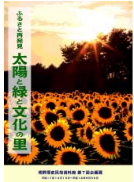
明野村とともに昭和を歩んだ懐かしの民具も展示